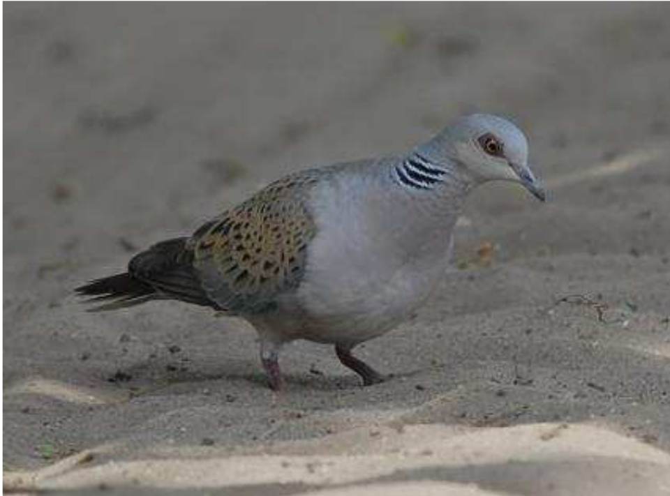
Deze rode lijstsoort, de Zomertortel, was in 2009 niet meer te vinden

De eindconclusie is dat sinds 1988 er zich verschuivingen binnen de vogelpopulaties hebben voorgedaan. Deze verschuivingen zijn deels te herleiden tot een landelijke daling of stijging van de broedvogelaantallen (zie de BMP-index in tabel 3). Daarnaast zijn er ook plaatselijke factoren in het spel, vooral met betrekking tot de bosvogels. De licht negatieve tendens is deels in strijd met de landelijke tendens, met name voor Sperwer, Grote Bonte Specht, Kleine Bonte Specht, Vuurgoudhaan en Appelvink. De negatieve tendens kan te maken hebben met bosbeleid en beheer, met recreatiedruk, met jacht of met verdroging. Daar kan beleid voor de toekomst op worden gezet.